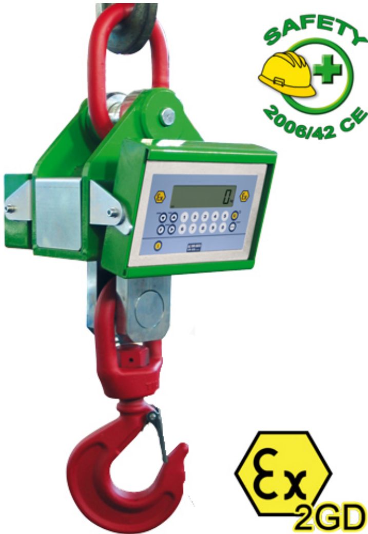
MCWATEX2GD mit optionalem Ring und Haken.

Kranwaagen, die für Wägeanwendungen in explosionsgefährdeten ATEX Bereichen klassifiziert sind (Zone 1 und 21, 2 und 22), mit Schutzart gemäß Ex II 2GD IIC T4 T197°C X. Verringerter vertikaler Platzbedarf für den optimalen Einsatz von Hebe-Einrichtungen. Vorgesehen für die Aufnahme eines Verbindungsringes (oben) und eines Hakens (unten). Ausgestattet mit einem Testzertifikat, das mit Prüfgewichten bis zu einem Wägebereich von 15000 kg durchgeführt wurde.