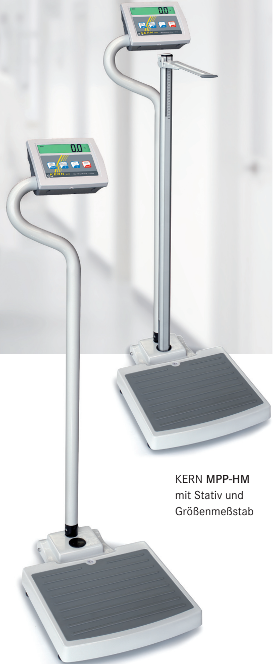
KERN MPP-HM mit Stativ und Größenmeßstab