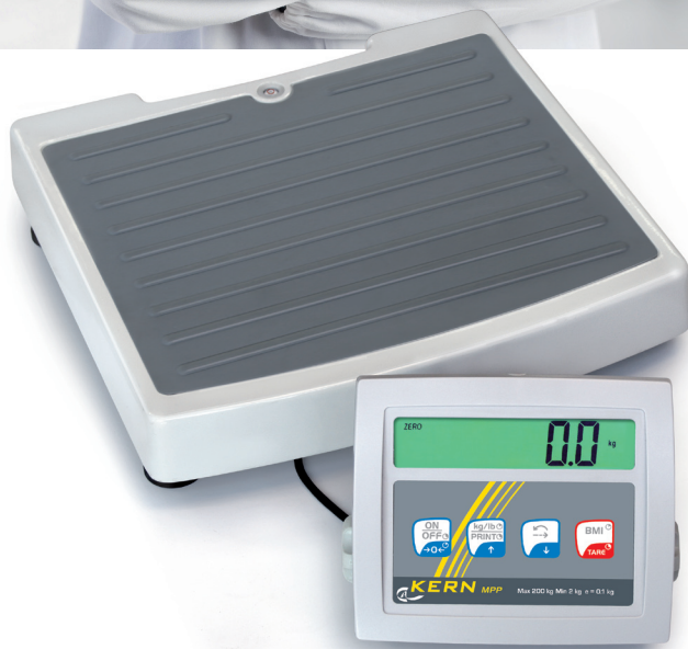
KERN MPP-M mit freistehendem Anzeigerät