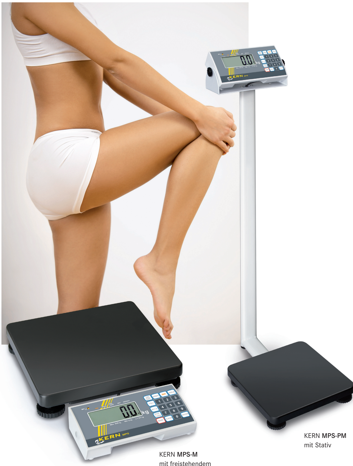
KERN MPS-M mit freistehendem Anzeigerät