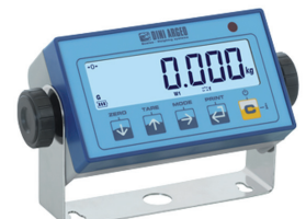
Anzeige DFWL Siehe Seite 4