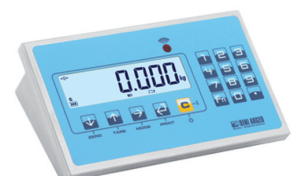
Anzeige DFWLKI Siehe Seite 4