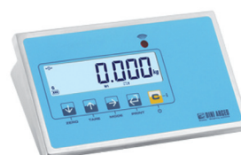
Anzeige DFWLI Siehe Seite 4