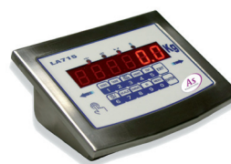
Anzeige AS-LA715 Siehe Seite 8